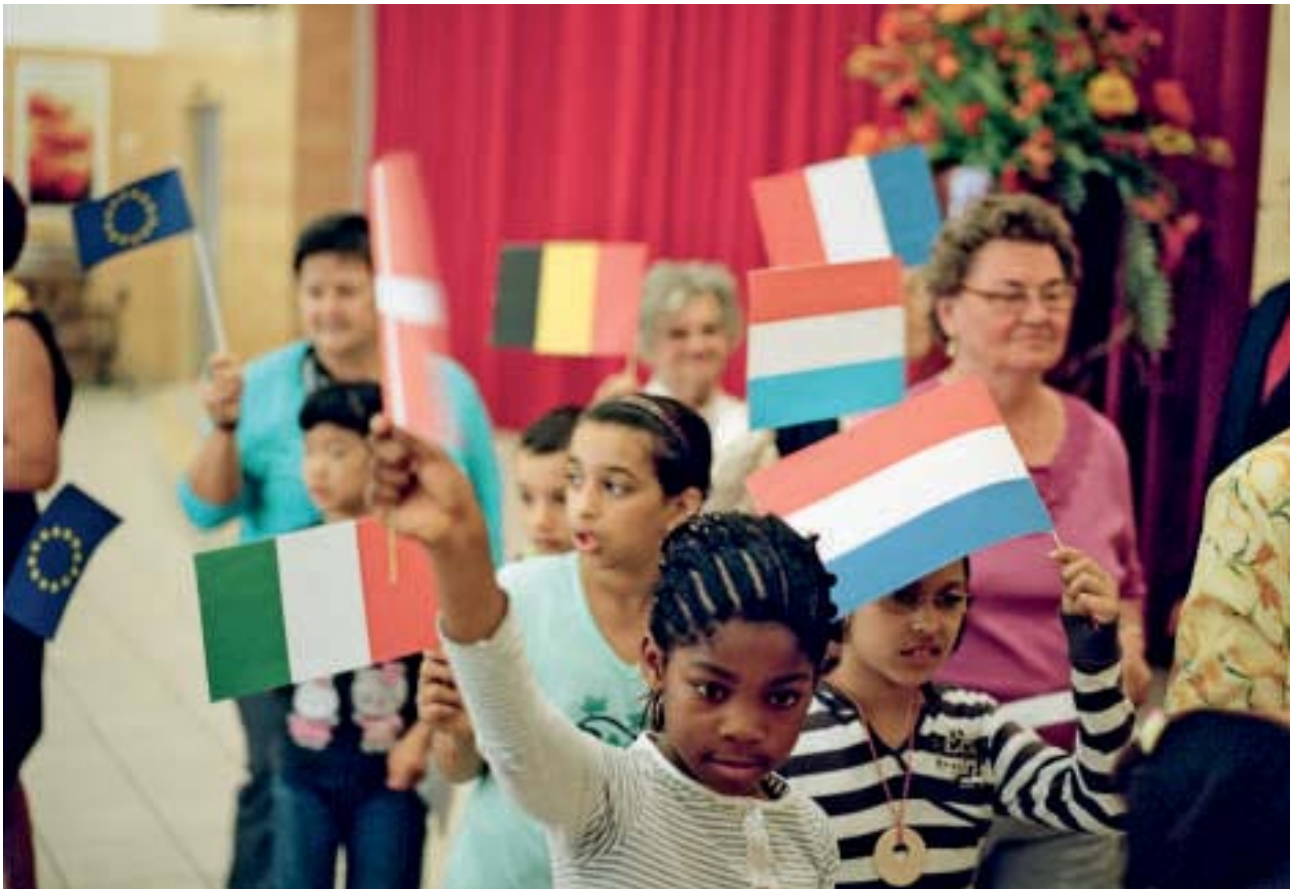
Mehr Toleranz füreinander

die Sozialdemokratie darf nicht in einen billigen Populismus verfallen. So sind zum Beispiel sowohl diejenigen anzusprechen, die vor einer zu massiven Zuwanderung Angst haben und Nachteile befürchten, als auch die verschiedenen ZuwanderInnengruppen selbst. Die Botschaften werden dabei unterschiedlich sein müssen, aber sie dürfen nie im Gegensatz zueinander stehen. Sie müssen im Ziel der Integration mit der gegenseitigen Achtung der Pflichten und Rechte münden. So müssen sich unterschiedliche Gruppen und Menschen mit verschiedenen Lebensläufen mit der Sozialdemokratie identifizieren können als einer Bewegung, die Fairness, Gerechtigkeit und Toleranz als vorrangige Ziele verfolgt.