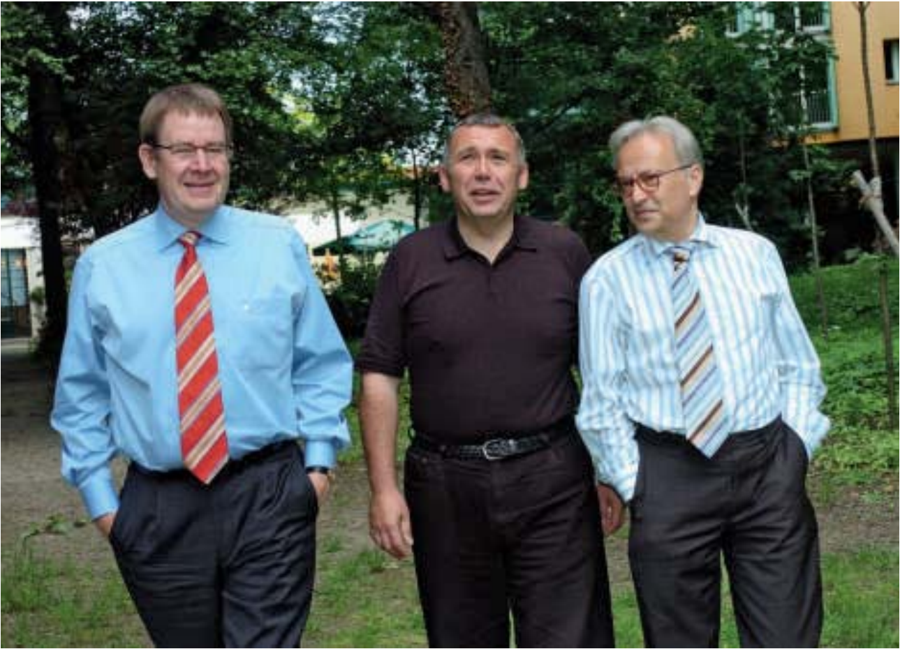
V.l.n.r.: Paul Nyrup Rasmussen, Alfred Gusenbauer, Hannes Swoboda