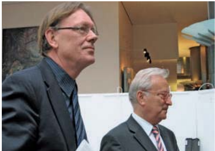
Mit Jan Marinus Wiersma

EU policies must reinforce national and local initiatives and construct an enabling and strategic European framework for our societies. The Europe of 2020 should neither be a Super State nor only a marketplace. According to social democrats it should be a promoter and enforcer of national, regional and local efforts in sustainable economic growth, human rights inclusiveness and quality of life supplementing and supporting the necessary global efforts. This cannot be separated from the global challenges for the EU, where it needs to carve out a leadership role among a growing number of emerging global actors. Social democrats must articulate Europe's responsibility to act according to these principles globally. Because worldwide poverty is not only a shame and to fight against it is more than a moral obligation: it is also a question of long-term global security. The same is true for climate change and demographic