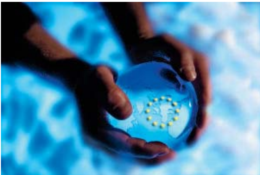
Die wieder gewachsene Ungleichheit von Einkommen, Vermögen und Lebenschancen sind für eine moderne Sozialdemokratie eine Herausforderung