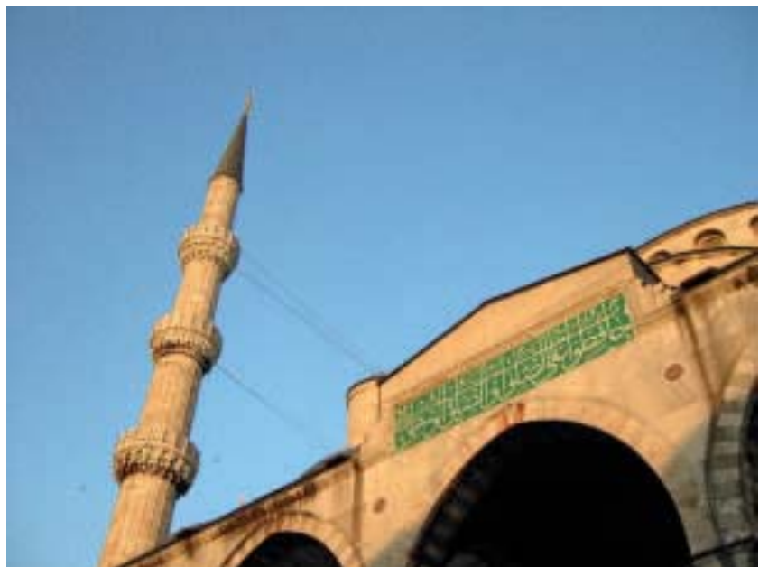
Religiöse Zuspitzungen vermeiden

Die soziale Frage steht im heutigen Europa immer wieder im Schatten engstirniger nationalistischer und „religiöser“ Polemiken. Die Zuspitzung auf Differenzen zwischen Inländer und Ausländer bzw. zwischen Christentum und Islam überdeckt die sozialen Fragen und lenkt vom Kampf für mehr soziale Gerechtigkeit ab. Europa im Jahre 2020 muss diese „künstlichen“ Spaltungen zwischen „uns“ und den „anderen“, zwischen den Einheimischen und den Fremden, überwunden haben. Wir müssen Gesellschaften der Toleranz und der Vielfalt an Ideen, Weltanschauungen und religiösen Bekenntnissen beherbergen, aber immer auf der Grundlage der