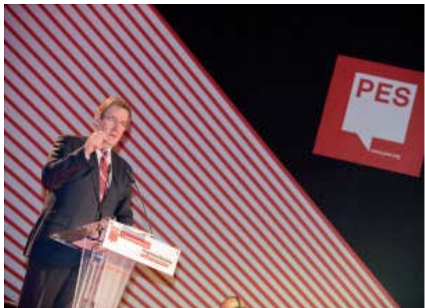
PSE-Vorsitzender Paul Nyrup Rassmussen

Und dieses Prinzip gilt es dann auch auf die europäische und internationale Ebene zu übertragen. Ist es fair, dass in einigen Ländern Steuertransparenz herrscht und in einigen anderen Ländern hingegen nicht? Ist es fair, dass es für die großen Einkommen Steuerparadiese gibt oder nicht? Und ist es fair, dass in Folge der Umweltverschmutzung in einigen Ländern andere ihre Lebensgrundlagen verlieren? Auch die Entscheidung, ob einige Länder Studienbeschränkungen einführen und andere, die dies nicht tun, dann