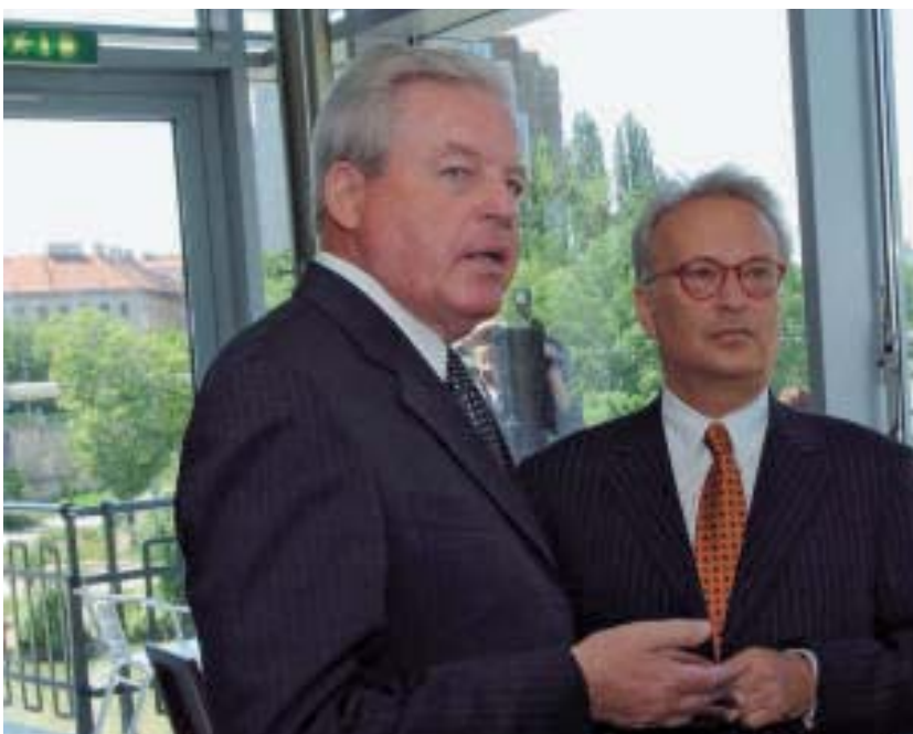
Mit Bundeskanzler a.D. Franz Vranitzky