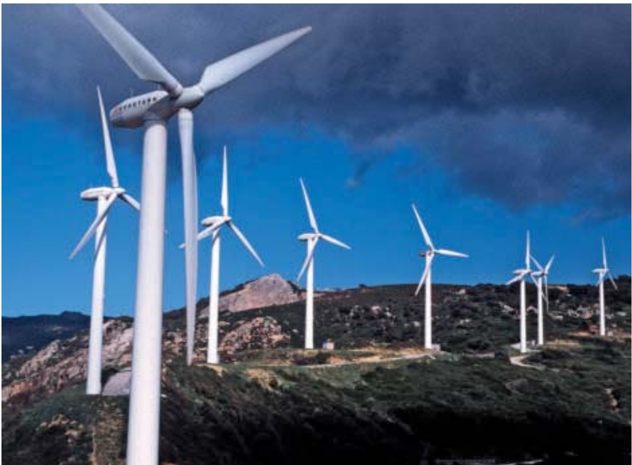
Europa muss durch seine Klimapolitik Vorbilder abgeben

Akteuren oder dem globalen Chaos unterwerfen. Denn das wären die Konsequenzen, würden wir den Nationalisten folgen. Die Alternative dazu ist, dass Europa spätestens 2020 mit einer starken, unüberhörbaren Stimme spricht. 2020 sollte der Vertrag von Lissabon mit Leben ausgefüllt sein. Nicht nur die minimale juristische Anwendung ist gefragt, sondern die Umsetzung seiner politischen Zielsetzungen.