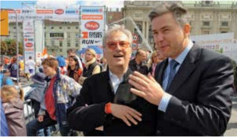
Mit Berlins Oberbürgermeister Klaus Wowereit

anxiety and insecurity, which is one of the backgrounds of the distrust and scepticism social democrats often face. Political challengers employ varying combinations of issue based politics, value orientations and populist sentiment to attract voters. The centre-right has internalised much of the social market agenda, while beneath the surface it often pursues a combination of economical deregulation and, increasingly, cultural conservatism or nationalism.