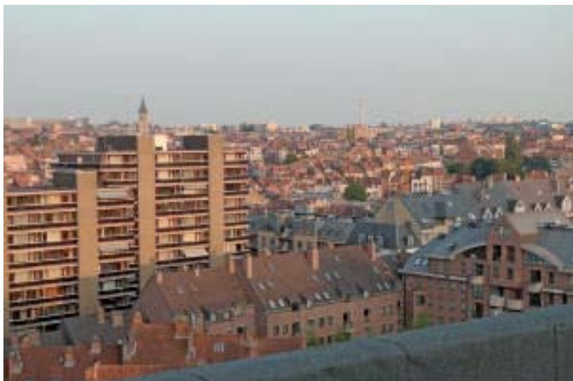
Blick auf Brüssel

Wie ich schon in einem Bericht von einer Tagung in der letzten Tour d'Europe dargestellt habe, sind Emotionen, Begeisterung und Werte wichtige Elemente erfolgreicher