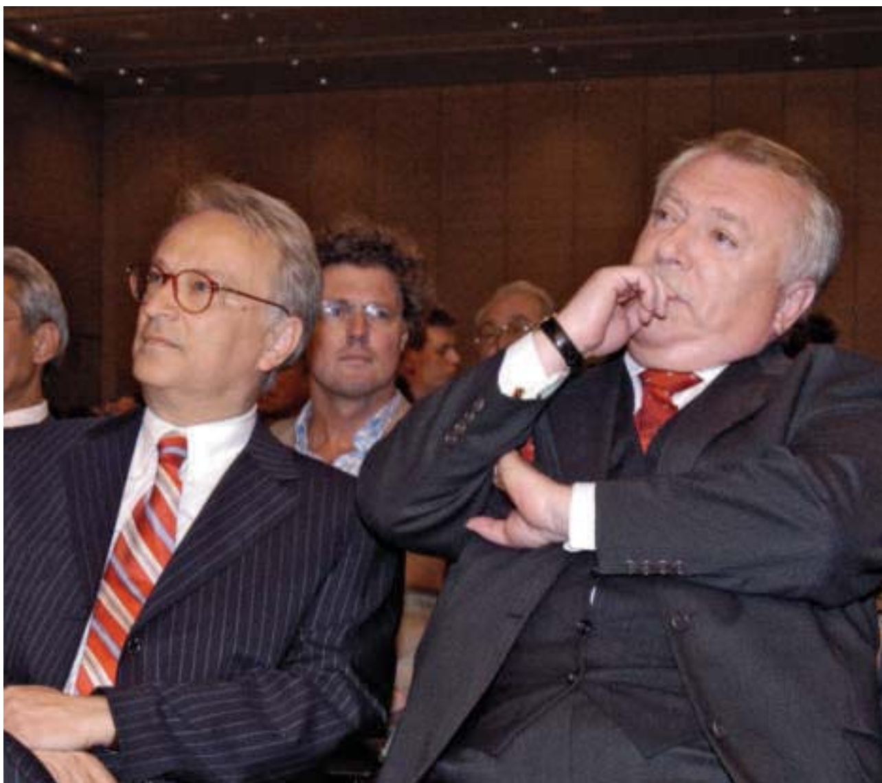
Mit Wiens Bürgermeister Michael Häupl