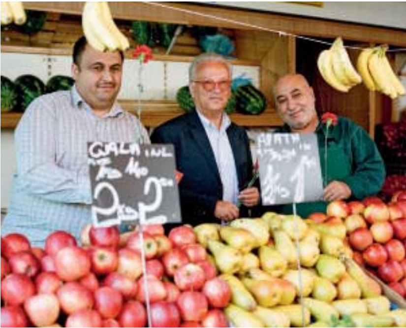
Miteinander statt gegeneinander auf dem Weg zu einer europäischen Identität

hinwegzuleugnen. Und überdies zielen wir auf Integration und nicht auf Assimilation, wenngleich die Unterschiede nicht so scharf sind wie das oft dargestellt wird. Aber es gibt natürlich noch einen anderen Einwand gegen die Debatte über die „nationale Identität“.