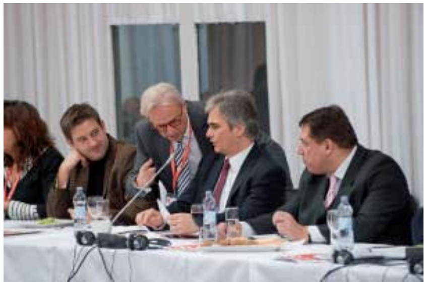
Mit Bundeskanzler Werner Faymann am PSE Kongress

positive Diskriminierung der Talente aus den ärmeren Schichten nicht. Mein dritter Punkt war die notwendige global abgestimmte internationale Finanzregulierung. Da gibt es die Kritik, eine solche Regelung könnte das Volumen auf den Finanzmärkten einschränken. Dazu kann ich nur sagen, dass ich darin keine große Gefahr sehe. Denn viele dieser Finanztransaktionen sind gesellschaftlich ohnedies problematisch. Da werden riesige Summen hin- und hergeschoben, ohne dass dies einen produktiven Beitrag für die Gesellschaft bewirkt. Ich leugne keineswegs den Nutzen der Finanzmärkte und auch neuer Instrumente für den produktiven Sektor. Aber die hypertrophe Entwicklung, das Bilden von spekulativen Blasen, leistet diesen produktiven Beitrag nicht. Im Gegenteil: Derartige Fehlentwicklungen zerstören Arbeitsplätze und Produktionskapazitäten. In der Umsetzung solcher Zielsetzungen ist die europäische Sozialdemokratie nicht allein, so mein vierter Punkt. Progressive Kräfte in den USA, in Japan, in Australien etc. hatten in