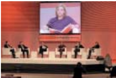
PSE Kongress in Prag

Derartige Kongresse sind – leider – selten eine Gelegenheit für eine ernsthafte Auseinandersetzung mit den Problemen, mit denen sich die europäische Sozialdemokratie konfrontiert sieht. Genau die könnten wir allerdings dringend brauchen. Man kann eine ernsthafte Auseinandersetzung aber ohnedies nicht auf einem Kongress erledigen – dazu bedarf es einer tiefer gehenden und intensiveren Debatte.