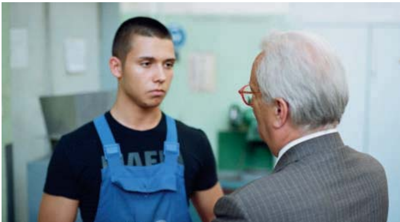
Wir müssen versuchen, insbesondere die Jugend wieder zu gewinnen

die Ziele umzusetzen. Sicher ist dies alles leichter gesagt als getan, aber das ist aus meiner Sicht ein guter Kriterienkatalog, der jedenfalls eine geeignete Grundlage für die Überarbeitung einer erfolgreichen politischen Strategie darstellt. Vor allem darf man gesellschaftliche Veränderungen nicht verschlafen und muss versuchen, insbesondere die Jugend wieder zu gewinnen. Dabei gilt es nicht, ihren Forderungen blindlings nachzugeben. Sie vertragen durchaus eine ehrliche Auseinandersetzung, aber sicher kein Vorbeireden an ihren Vorstellungen und ihrer Kritik. Die Diskussion und das Ringen um Inhalte und Maßnahmen sozialdemokratischer Natur können nicht kurzfristig abgeschlossen werden. Zu tief sind die gesellschaftlichen Veränderungen und zu stark die Einbrüche in unserer Wählerschaft, als dass kurzfristige und oberflächliche Korrekturen genügen würden. Madrid, 3.10.2009