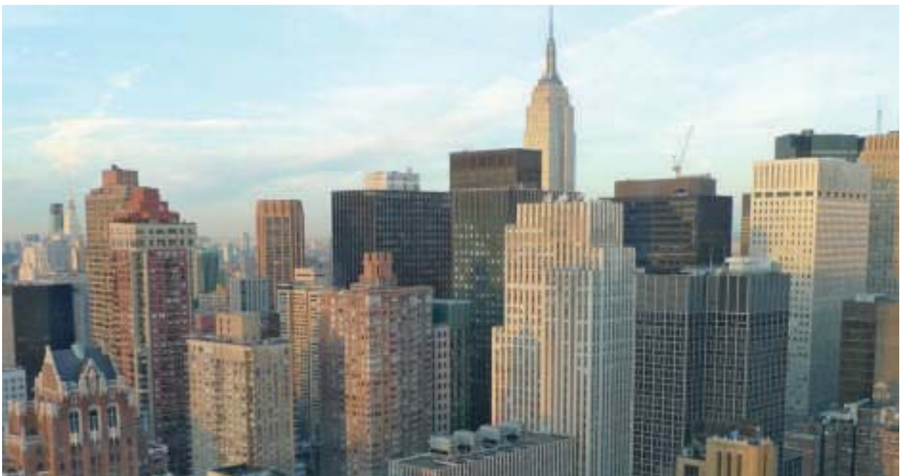
Die USA spielen weiter eine entscheidende Rolle

Wirtschaftspolitik gäbe, sondern nur eine gute oder eine schlechte. Damit wurde allerdings der Eindruck vermittelt, dass grundsätzliche politische Orientierungen an sich keinen Wert mehr besitzen und leichtfertig über Bord geworfen werden können. Die Rechte hat dazu applaudiert und ihre konservative Wirtschaftspolitik als „die einzig gute“ verkauft und diese Haltung oft noch mit nationalistischen Untertönen bei der Bevölkerung abgesichert.