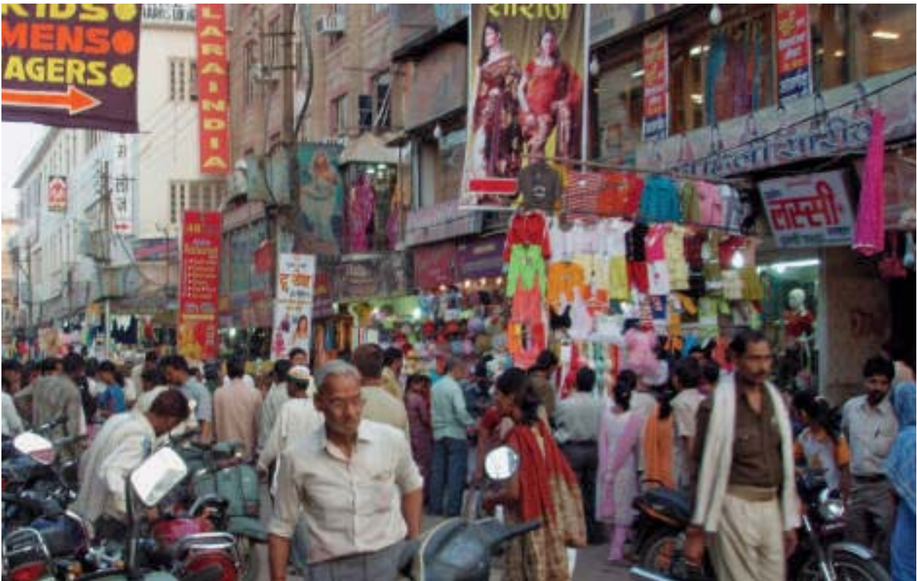
Nicht nur Indien wird an Einfluss gewinnen

unterscheidbare Reformstrategie zu entwickeln. Das ist ein wesentlicher Bestandteil unseres Identitätsverlustes. Hinzu kommt, dass das von manchen herbei beschworene „Ende der Geschichte“ infolge des unwiderruflichen Sieges des Kapitalismus über den Kommunismus die Situation der Sozialdemokratie nicht gerade erleichtert hat. Nun gilt es, wieder zu einer ausbalancierten Position zwischen Marktradikalismus und Staatsinterventionismus zurückzukehren. Denn gerade darum geht es bei der Sozialdemokratie. Sie muss bestrebt sein, Markt und Staat, Freiheit und Regulierung in einer begründbaren Balance zu halten.