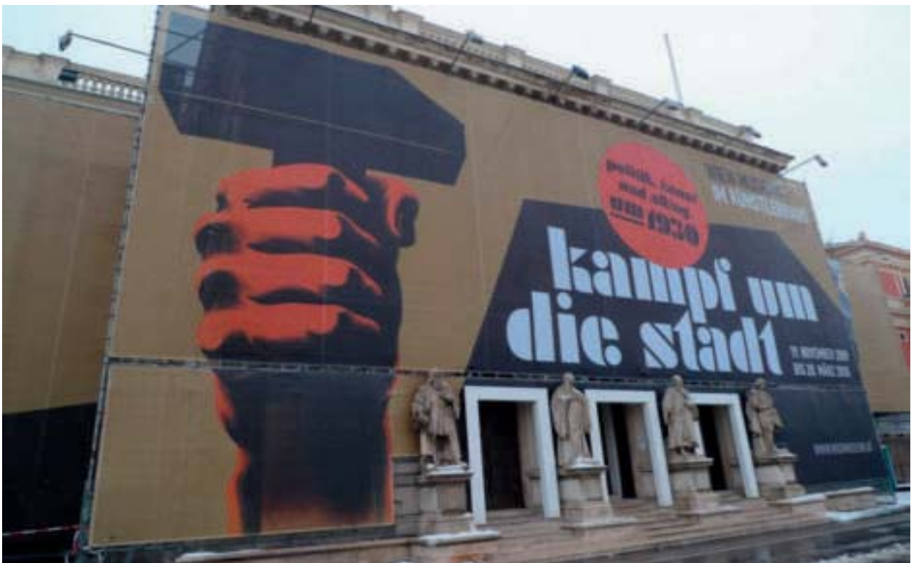
Gewisse Parallelitäten zu Heute fallen auf

Soweit zur Geschichte. Was aber auffällt, sind gewisse Parallelitäten zu heute. Auch heute ist die Rechte aufgespalten in eine moderate, konservative Rechte und in eine aggressivere, nationalistische Rechte. Gerade Letztere ist es aber, die in die Wählerschaft der Sozialdemokratie einbricht. Vor allem dann und dort, wo die Linke die ideologische=grundsätzliche Auseinandersetzung aufgibt und dieses Feld der Rechten überlässt. Weder fordere ich eine Wiedereinführung von Straßenkämpfen durch paramilitärische Organisationen noch eine straffe Reideologisierung.