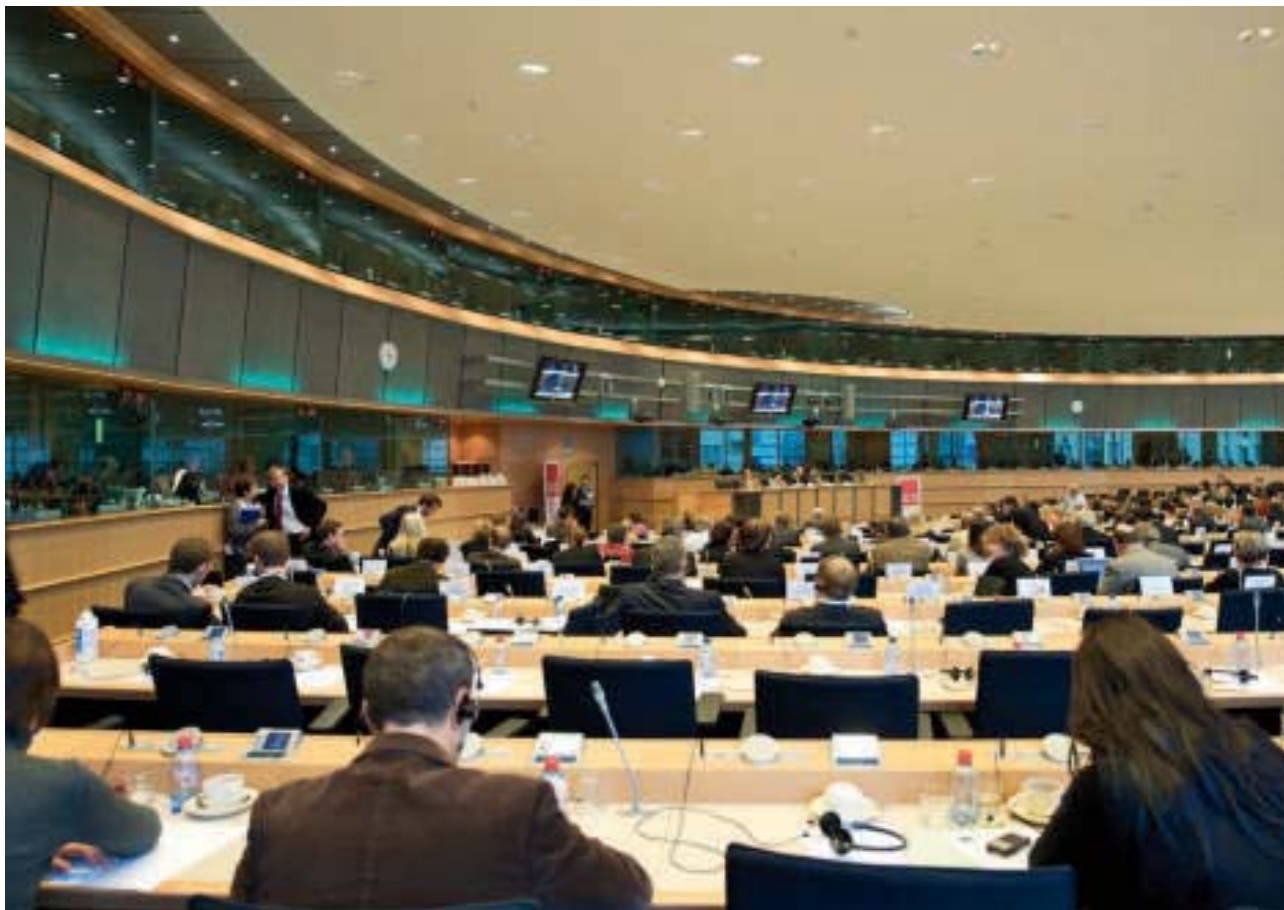
Fraktions Sitzung in Brüssel

Aber auch die Mittelschichten und die höheren Bildungsschichten finden die traditionelle Sozialdemokratie nicht mehr sehr attraktiv, sie wandern zu den Konservativen. Noch dazu, wo sich viele dieser Parteien vormals sozialdemokratische Zielsetzungen zu Eigen gemacht haben. Sie lassen dabei auch unkonventionelle Typen, die dem klassischen konservativen Bild widersprechen, zu. So wird die klassische Sozialdemokratie zerrieben. Würde sie sich nur mehr auf die traditionellen Schichten konzentrieren, würde der Abbröcklungsprozess genauso weitergehen wie bei einer ausschließlichen Orientierung an der Mittelschicht.