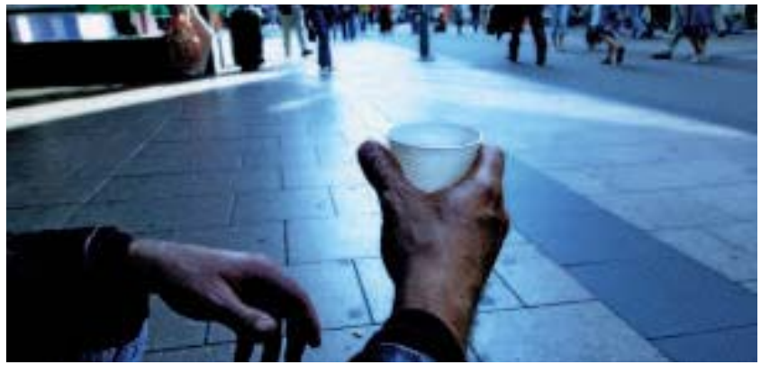
Solidarität muss neu erfunden werden

Drittens hat die Sozialdemokratie bestimmte Dichotomien bzw. Gegensätze nicht rechtzeitig neu vermittelt. So geht es weder um mehr Staat noch um mehr Markt generell. An die Problemstellungen angepasste Lösungen müssen gesucht und gefunden werden. Wir brauchen bei vielen öffentlichen Leistungen mehr betriebswirtschaftliches Denken, ohne diese Leistungen selbst dem Privatisierungsstre-