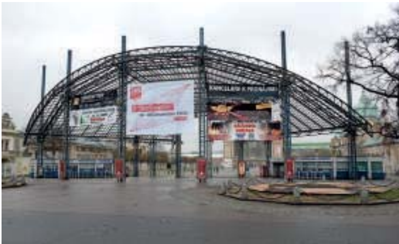
PSE Kongress in Prag

Die vorliegende Broschüre präsentiert einige Diskussionsbeiträge und Kommentare für zwei derzeit noch getrennt geführte Debatten. Die eine bezieht sich auf das EU-Projekt „Europa 2020“. Dabei versuchen Kommission, Parlament und Rat Europa auf das Jahr 2020 vorzubereiten bzw. zu skizzieren, welches Europa wir uns im Jahre 2020 wünschen und