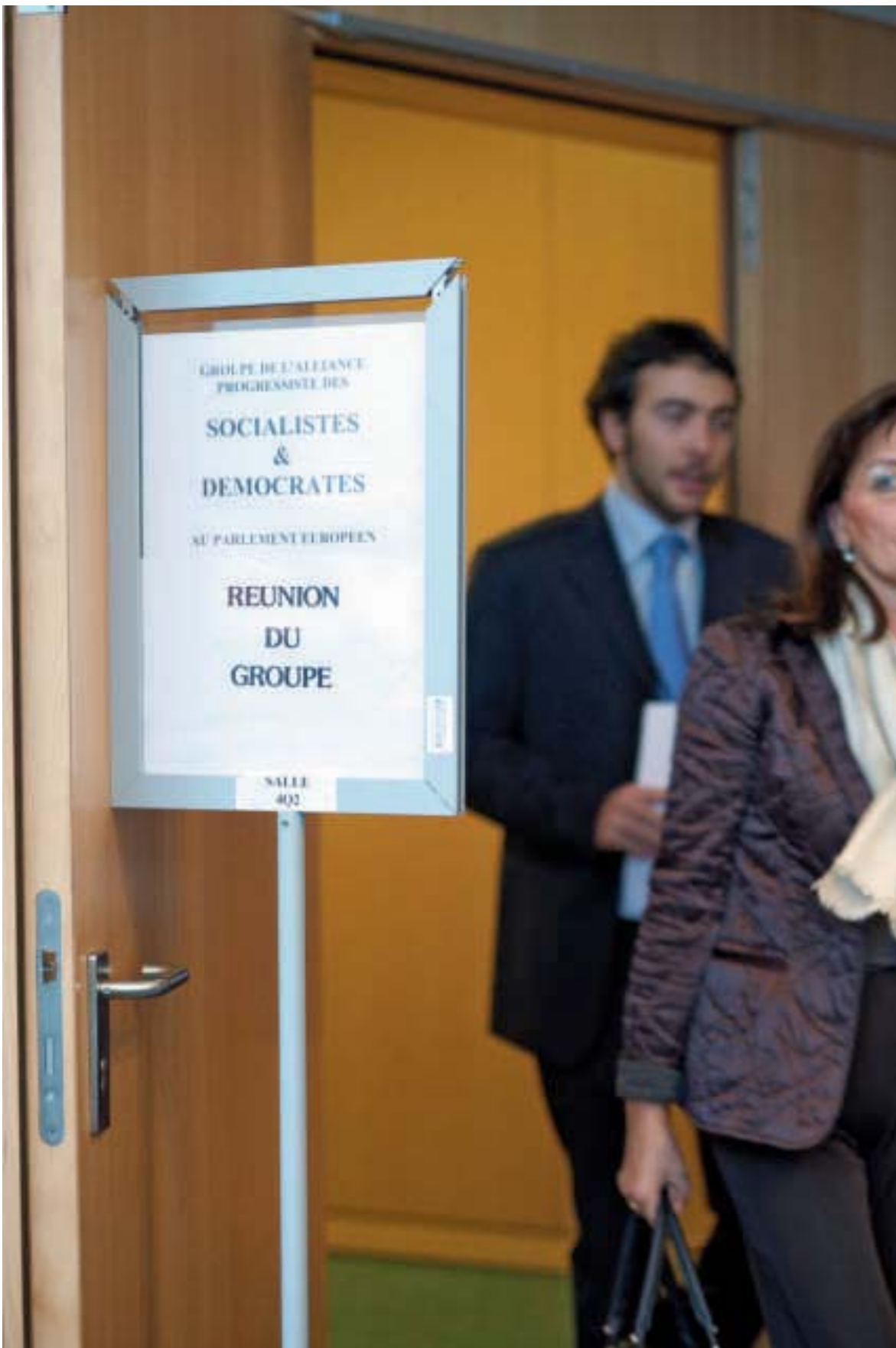
Neue Allianz im EU-Parlament