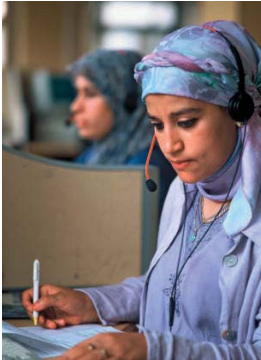
Die Sozialdemokratie muss sich als gesellschaftliche Kraft einmischen

Das Verhältnis eines aufgeklärten europäischen Staates zur Religion ist in letzter Zeit wieder Gegenstand einer ausführlichen Diskussion geworden. So sehr ich mich über die Reaktionen auf meinen letzten Beitrag in dieser Rubrik freue, so sehr waren manche Debattebeiträge im EU-Parlament im Zusammenhang mit einem Urteil des Europäischen Gerichtshofs für Menschenrechte in Straßburg entbehrlich. Ich finde es überhaupt äußerst problematisch, Gerichtsurteile durch Parlamentsresolutionen zu kommentieren oder gar zu kritisieren. Aber das „Kreuz“ ist plötzlich zu einem kulturellen Symbol geworden. Mit dem Kruzifix lebt und stirbt unsere christlich abendländische Kultur. Es ist durchaus anzuerkennen, dass die christlichen Religionen – durch das Kreuz symbolisiert – in Europa insgesamt, jedenfalls in den Staaten der EU, den größten Einfluss gehabt haben und natürlich heute noch haben. Und das sollte auch nicht geleugnet werden. Dies ist allerdings mit der Tatsache zu verbinden, dass heute – zum Teil wieder – andere Religionen einen größeren Stellenwert in unseren Gesellschaften haben. Und das muss auch im Ausbau von Gebetshäusern zum Ausdruck kommen. Unabhängig davon müssen sich Religionen der Kritik stellen. Für die Entwicklung des christlichen Abendlandes ist der Übergang von einem unterwürfigen und unkritischen Verhältnis zur Religion zu einem aufgeklärten und kritischen Verhältnis sehr entschei-