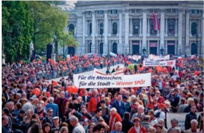
Eine stärkere sozialdemokratische Handschrift ist notwendig

Auf dem Weg zu einem sozialen Europa 2020 muss die EU nun diese realen und psychologischen Störungen korrigieren. So müsste die Entsenderichtlinie wasserdicht gemacht werden, um das Aushöhlen hart erkämpfter sozialer Rechte