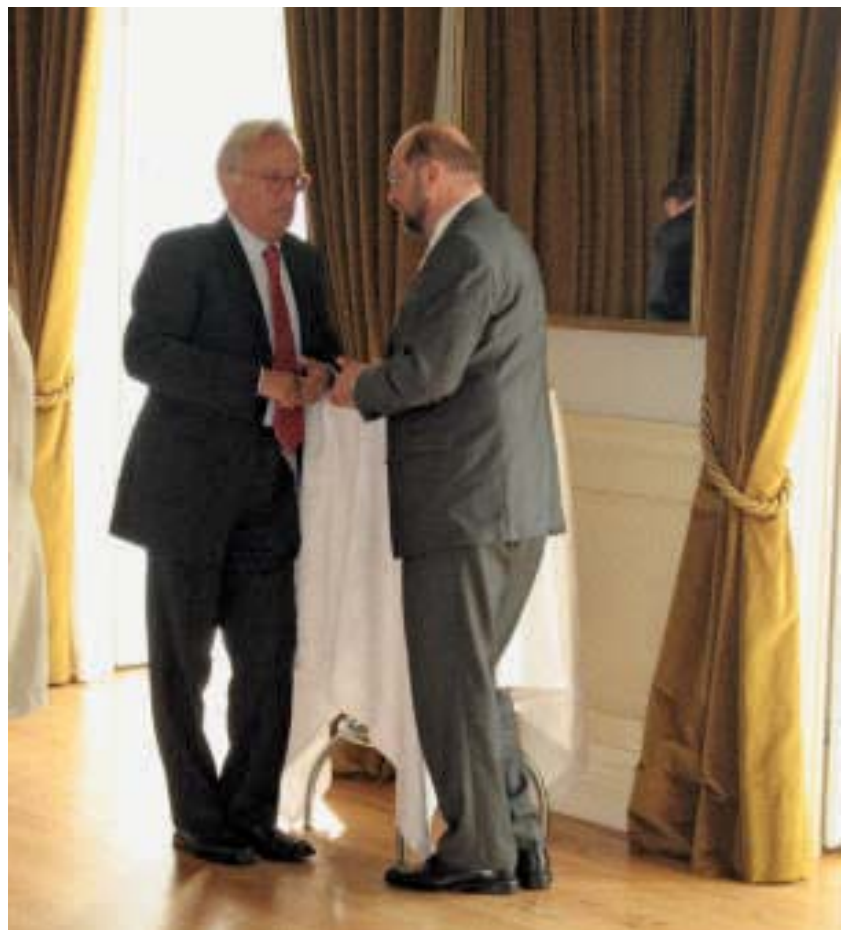
Mit Fraktionschef Martin Schulz

action but also a solid framework for regional and local initiatives. Our program should contain concrete ways of articulating how the restructuring of the European economy towards sustainability offers the prospect of creating new jobs and improve the environment at the same time. Here, we need to link cultural attitudes and economic patterns to the fight for a more sustainable environment, with the development of a clear attitude for clean politics, and (intergenerational) solidarity and the fight against poverty and inequalities. The issue of the quality of life with its economic, social, psychological and cultural dimensions has to be of central concern for social democracy.