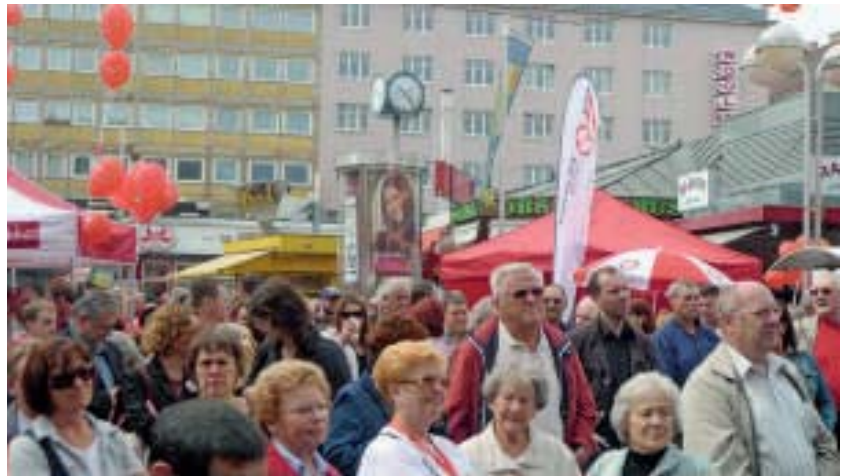
„Viele einladen, ein Stück des Weges mit uns zu gehen.“

Die Wirtschaftskrise liefert uns mit all der Tragik für die Arbeitslosen