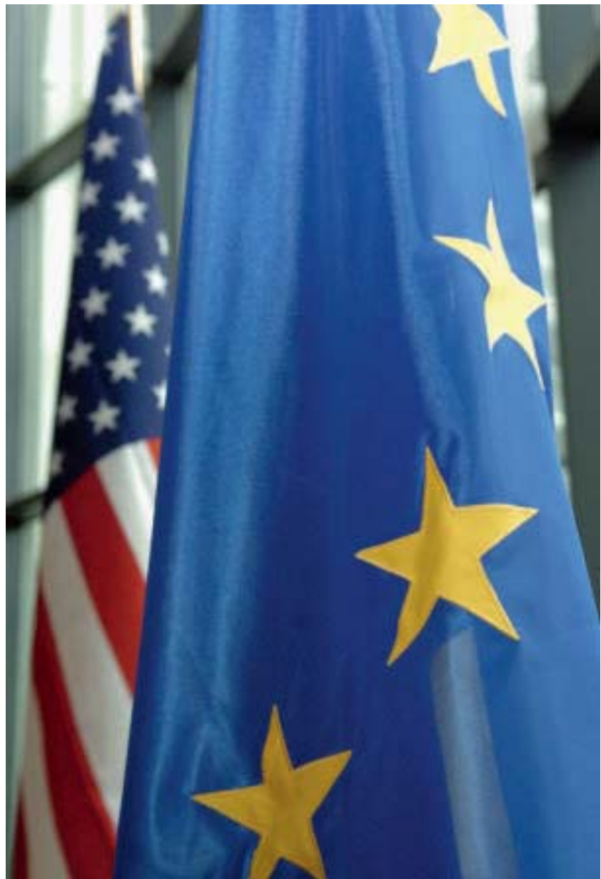
Unterschiedliche politische Entwicklungen in Europa und den USA

weit verbreiteten Angst vor "big government", also vor zuviel Staatsausgaben, um. Ihm ging es nicht um mehr Staat und mehr Steuern, sondern um mehr Gerechtigkeit. Und damit sprach Obama auch einen zentralen Wert an. Die gesamte Kampagne war nämlich nicht nur auf konkrete Massnahmen angelegt, die er versprochen hatte, sondern auch auf Werte, die Bush missachtet hat.