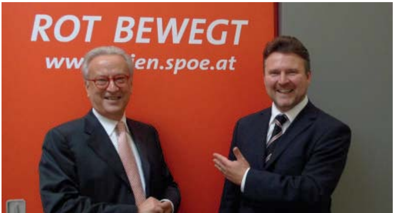
Mit Wiens Vizebürgermeister Michael Ludwig