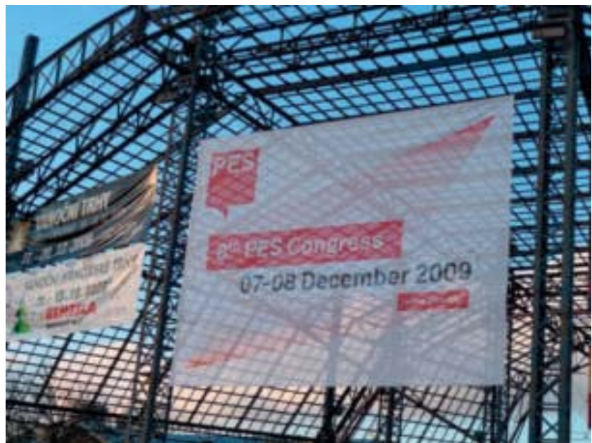
SPE-Parteitag in Prag

The success of many of Europe's social democratic parties in the 1990s was based on presenting a way out of the dichotomy between market and state, while maintaining the goals of social justice and equity. This allowed the centre-left to modernize the welfare state and pursue a comprehensive deregulation agenda in an age of economic optimism. At the same time, our economies underwent a fundamental transformation: the transition from organised industrial capitalism to global financial capitalism and a gradual shift from manufacturing to services. These developments reshuffled the field of economic governance, affecting the scope of state intervention. The Third Way's conviction that its policies could contain market forces was based on a previous version of capitalist organization that was fast disappearing. Moreover, the Third Way underestimated the political consequences of changing labour relations and the confusion between public and private its policies introduced. This now leaves social democrats struggling to credibly make a common case to tackle the flipside of the economic dynamism deregulation unleashed: job insecurity, in-work poverty and